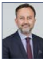
FRANÇOIS DECOSTER Vice-président de la Région Hauts-de-France, en charge de la culture, du patrimoine, des langues régionales et des relations internationales