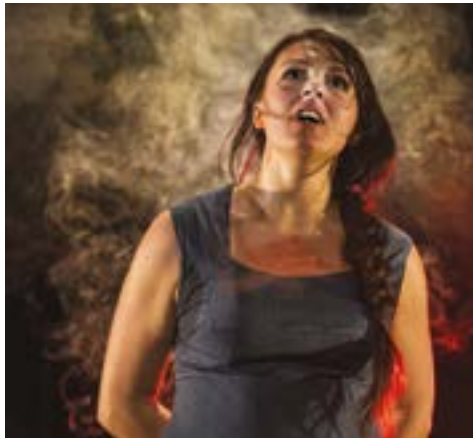
Figure originale et anticonformiste de la littérature française, Joseph Delteil écrit en 1925 sa version de l'histoire de Jeanne d'Arc.

Sur scène, une femme entre dans un théâtre vide. C'est Jeanne, elle est peut-être machiniste ou femme de ménage. Un personnage du quotidien qui refait l'histoire de son héroïne favorite, tant et si bien qu'elle finit par se l'approprier. Au milieu d'un décor conçu d'un bric-à-brac de seaux, de serpillères et de balais, une bouteille