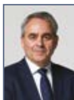
XAVIER BERTRAND Président de la Région Hauts-de-France

Cette vitalité n'est pas le fruit du hasard : elle est le résultat d'une politique culturelle constante, exigeante et profondément attachée à ses territoires. Une politique que nous continuerons à porter avec la même conviction, parce que la culture, plus que jamais, est ce qui nous fait tenir ensemble.